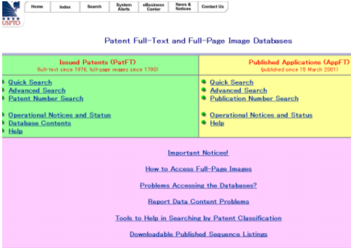
図 2: 米国特許商標庁特許情報検索ページ

米国特許商標庁のホームページへは http://www.jpo.go.jp/indexj.htm の下部右端の「関連ホームページリンク」をたどっていくと到達することができます。米国特許商標庁のホームページ http://www.uspto.gov/ を経由して「Patent Full-Text and Full-Page Image Databases」のホームページ http://www.uspto.gov/patft/index.html (図2) に到達することができます。