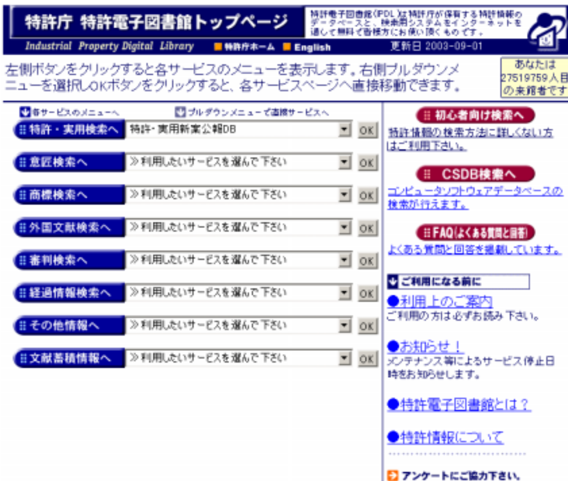
図 1: 特許庁電子図書館

日本国特許庁のホームページの URL は http://www.jpo.go.jp/indexj.htm です。このホームページの下部左端に特許電子図書館 (IPDL) というものがあります。IPDL のホームページ http://www.ipdl.jpo.go.jp/homepg.ipdl を開くと、図 1 のような画面が現れます。IPDL の検索機能を用いると過去の特許庁が発行したすべての特許文献・公報を見ることができるようになっています。もっとも電子化の優先順位の都合で全てのメニューにおいて検索できる範囲は一様であるとは限りません。